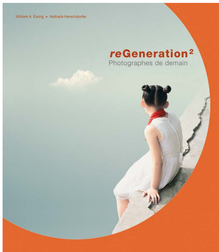
Couverture du catalogue de reGeneration2. Photographes de demain , Musée de l'Elysée, Lausanne / Thames & Hudson, Paris & Londres / Aperture, New York, 2010