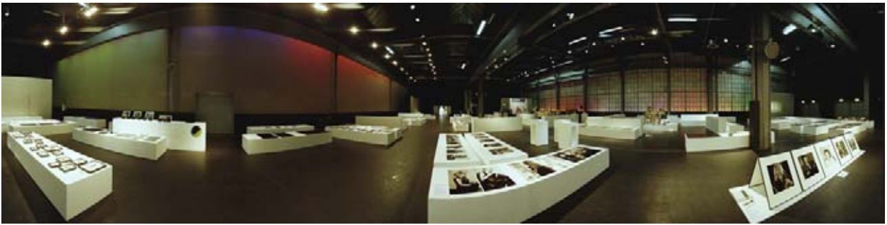
Photo Schweiz 08

Maag EventHall, Hardstrasse 219, 8005 Zürich