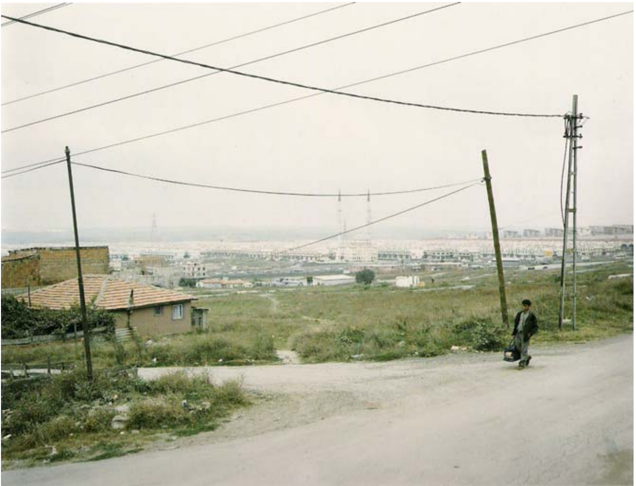
Jeff Wall, A Villager from Aricaköyü arriving in Mahmutbey-Istanbul, September, 1997 , 1997, transparent sur caisson lumineux, 210x271.5 cm [cinematographic photograph, prises de vue au 4x5" à Mahmutbey, banlieue d'Istanbul, Turquie, automne 1997]