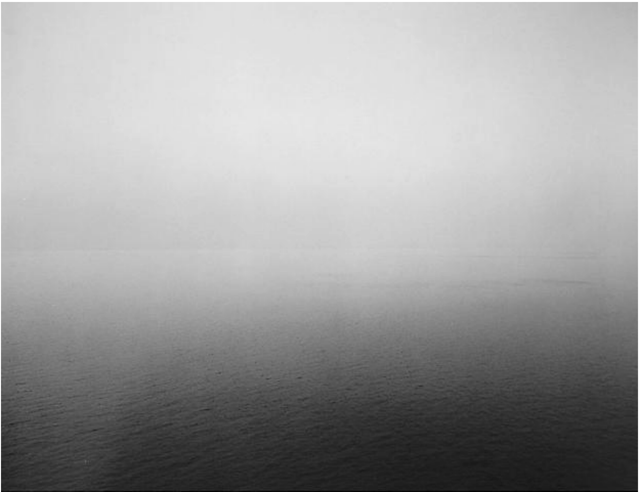
Hiroshi Sugimoto, Ionian Sea, Santa Cesarea , 1990, tiré de Seascapes , épreuve argentique, 152.4x182.2 cm