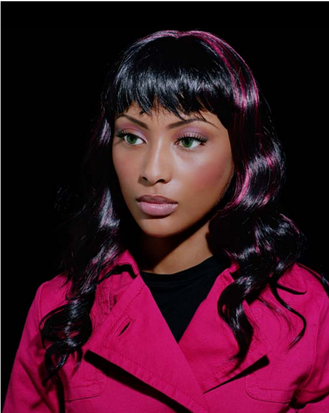
Valérie Belin, sans titre, 2006, n°060703, tiré de la série Métisses , 125x100 cm