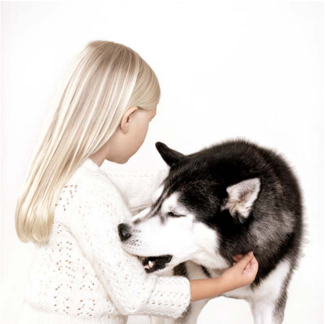
Petrina Hicks (Australie, 1972), Lambswool , tiré de The Descendants , 2008, épreuve lambda (lightjet print), 120x120 cm

Bonnes fêtes à toutes et à tous, meilleurs vœux pour la nouvelle année !!! NEAR