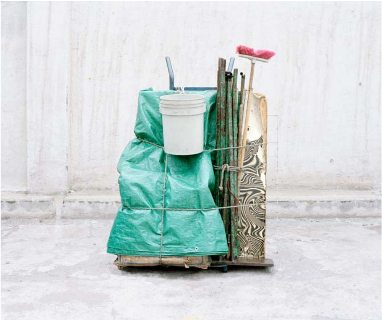
Élija Larvego, tiré de Sculptures immobiles , Mexico City, juin 2007