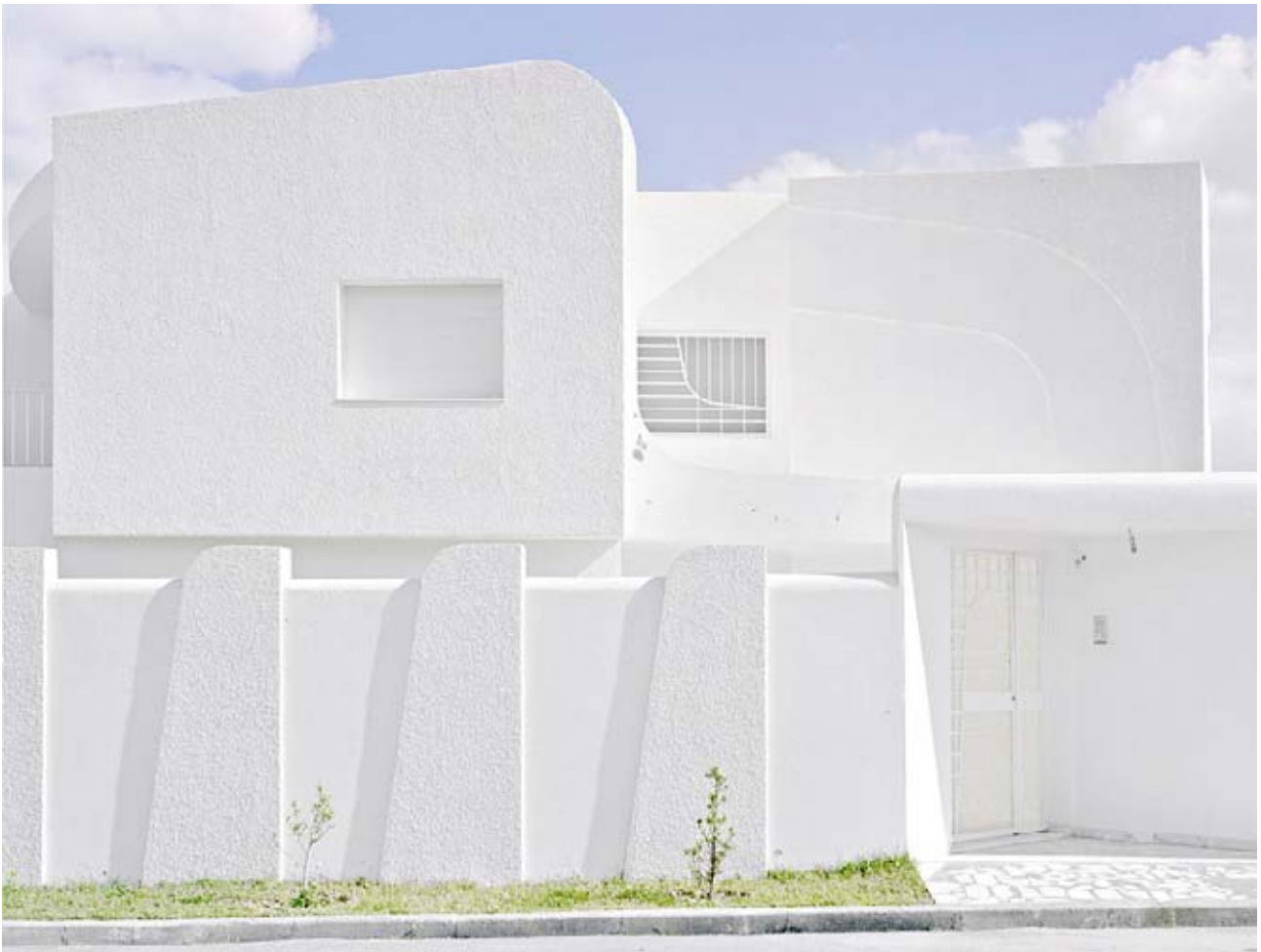
Matthieu Gafsou, tiré de Surfaces , partie 1, 2008