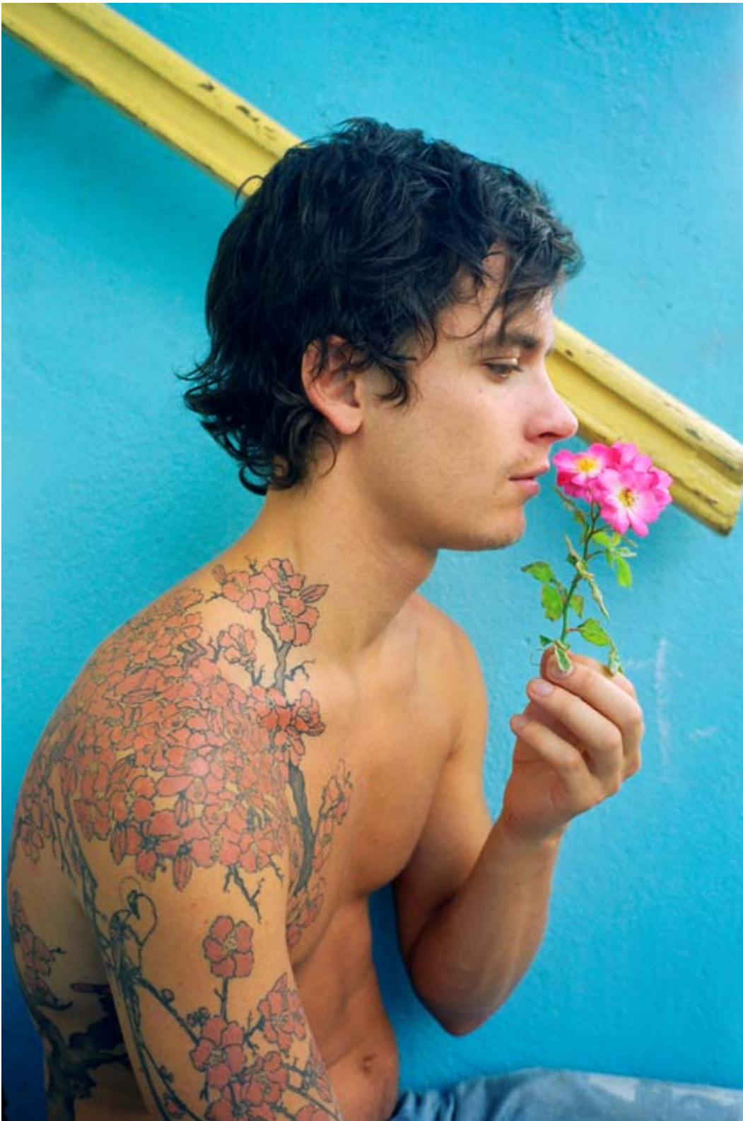
Walter Pfeiffer, sans titre, 2005, c-print, 116x79cm

Walter Pfeiffer. In Love with Beauty Fotomuseum Winterthur http://www.fotomuseum.ch/ Jusqu'au 15 février 2009