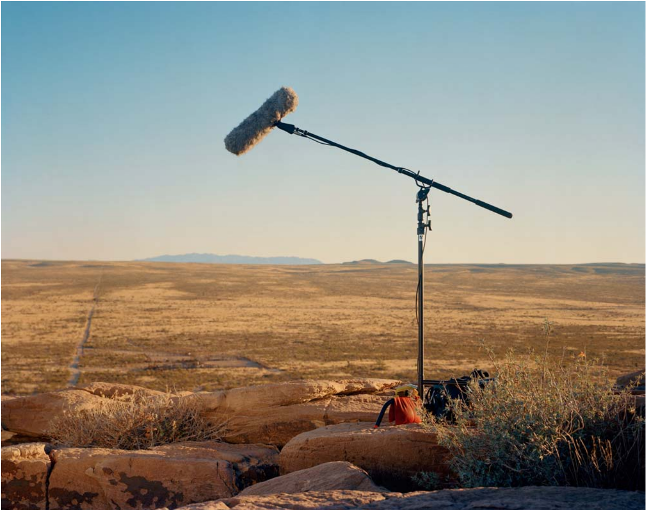
Teresa Hubbard / Alexander Birchler, Dead Cat on Movie Mountain, Sunset , 2011, c-print digital, 110x139 cm.