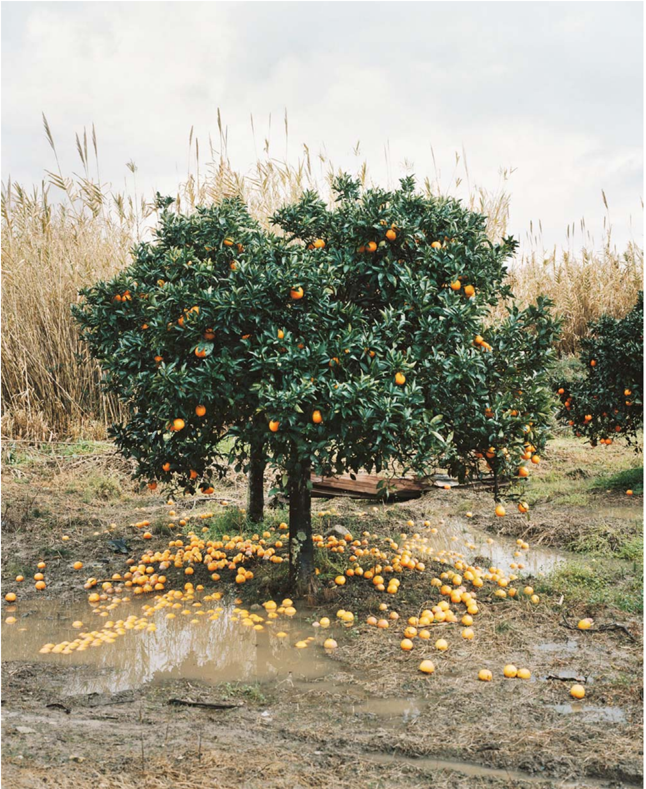
Eva Leitolf, Orange Grove, Rosarno, Italy , 2010, de la série Postcards from Europe , c-print, 81x69 cm

" In January 2010 the price obtained by Calabrian fruit-growers for Moro and Navel oranges was five euro cents per kilogram. They pay their mostly illegally employed and undocumented African and Eastern European seasonal workers between €20 and €25 for a day's work. Depending on the variety and the state of the trees a worker can pick between four and seven hundred kilograms of oranges in a day. Because the business is no longer profitable, many farmers now leave the fruit to rot.