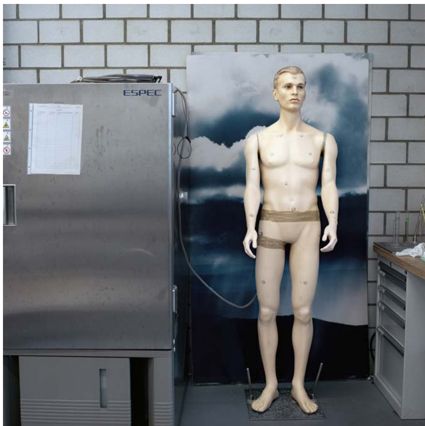
Danaé Panchaud, Sans titre , de la série Mannequins , 2004