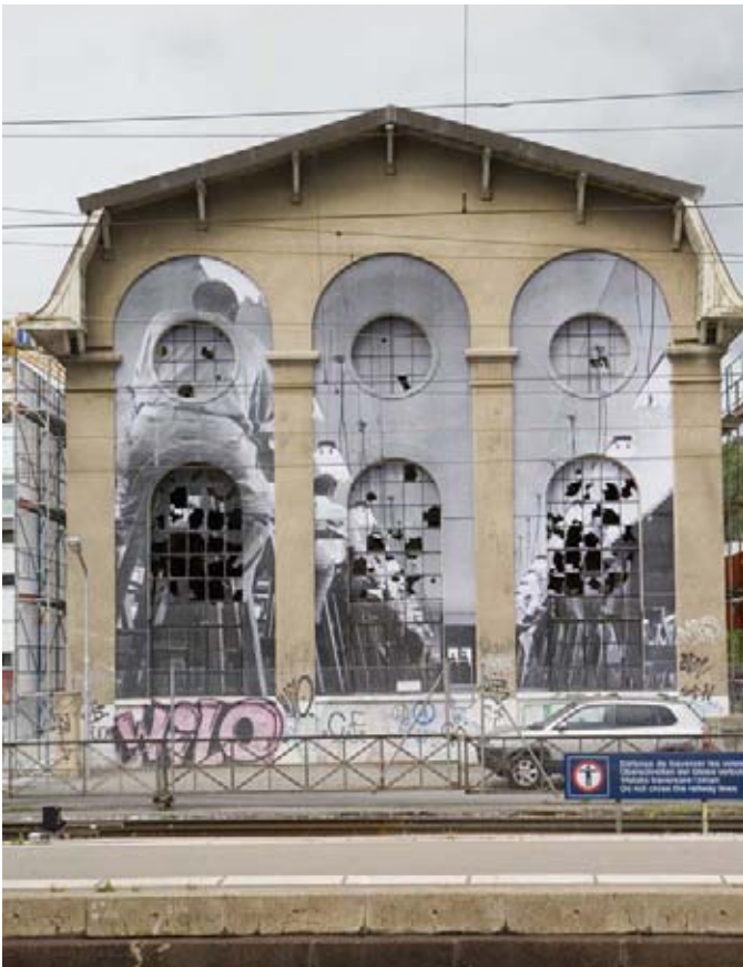
JR, Unframed, installation aux anciens Ateliers de constructions mécaniques, Vevey, 2010, avec une photographie originale de John Phillips, Ateliers à Corpus Christi