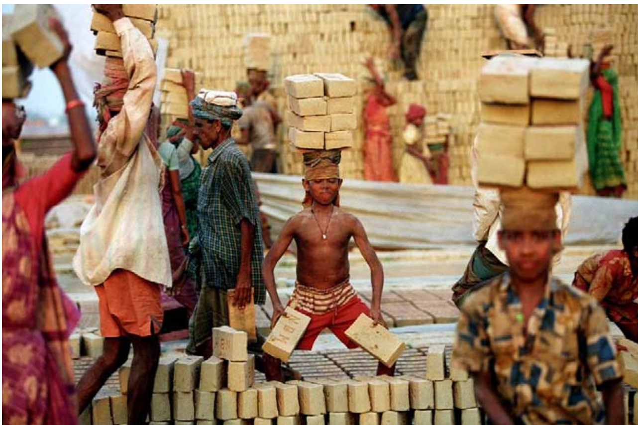
G.M.B. Akash, Brick making factory in Fatullah near Dhaka , Bangladesh, April 2010, de la série Born to work . The children from Gaibandha work at the brick factory until June, when Monsoon time starts and they return to work on their hometown's fields. Lauréat ex æquo du Grand Prix de la Ville de Vevey, 2009.