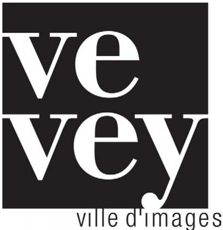
Logo de la Ville de Vevey. Graphisme : Peter Scholl