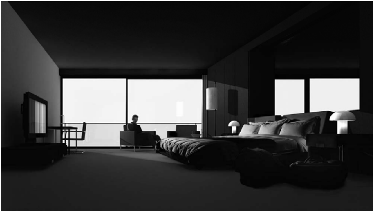
Hans Op de Beeck, de la série Room , 1, 2007. Caldic Collectie, Rotterdam