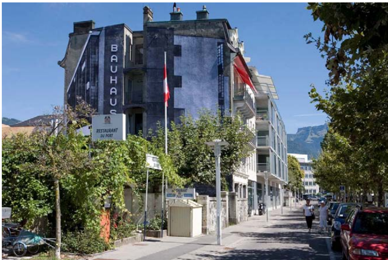
JR, Unframed , installation au Quai Perdonnet, Vevey, 2010, avec une photographie originale de Lucia Moholy, Bauhaus , Dessau, 1925-26 © Lucia Moholy / Bauhaus-Archiv Berlin © VG Bild-Kunst Bonn. Photographie : Celine Michel.

ND : Y a-t-il donc des thématiques à chaque édition du Festival Images ?