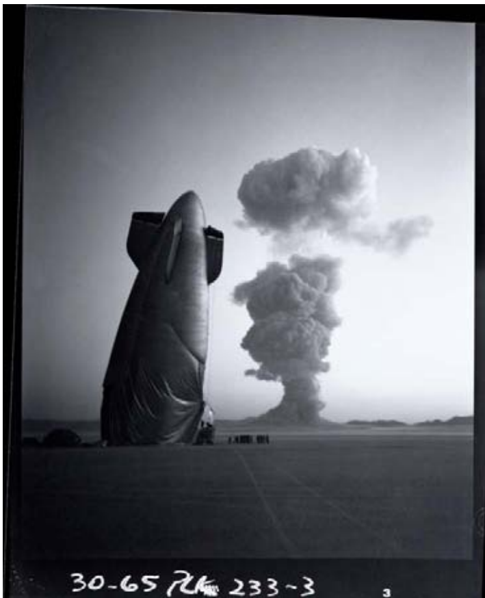
Michael Light, de la série 100 SUNS , 2003

ND : Comment évalues-tu le succès des expositions puisque plusieurs d'entre elles sont en extérieur ?