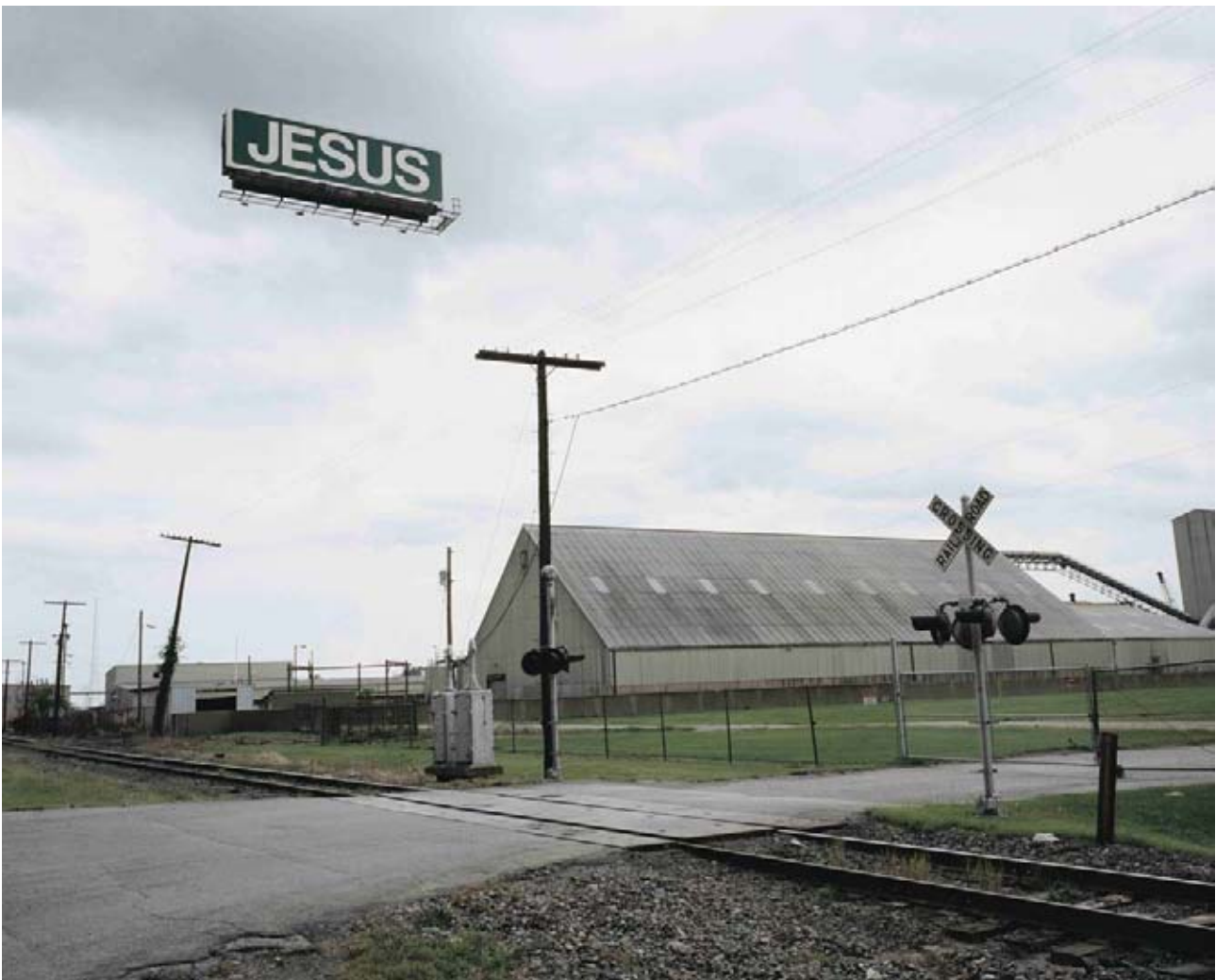
Matt Siber, Jesus , 2004, de la série Floating Logos

SS : Chez Li Wei, il s'agit d'une intrusion physique dans l'espace construit de la ville. Matt Siber présente la série Floating Logos qui traite de l'intrusion des logos dans l'environnement urbain, qui en est surchargé. Et ainsi de suite, je décline cette thématique de l'intrusion, en extérieur comme en intérieur.